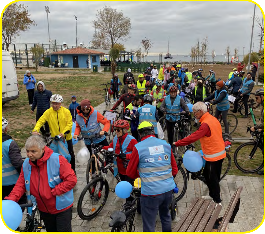
Türk Diyabet ve Obezite ÖVakfı ile Bisikletliler Derneği'nin iş birliği bu yıl da devam etti. Nice senelere diyoruz.